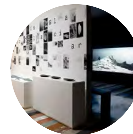
» Roca, Isla, Glaciar