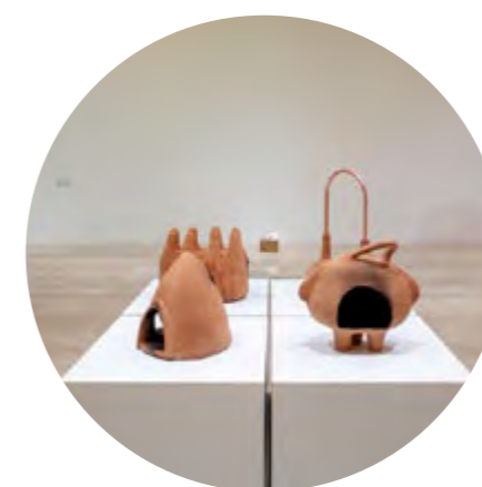
» Sofía Táboas: Gama Temática